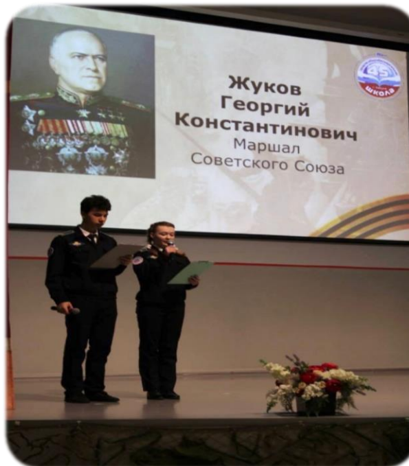
25 марта 2020 года школе присвоено имя Маршала Советского Союза Г.К. Жукова