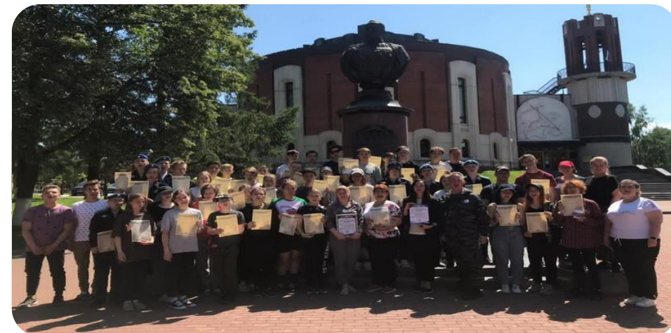
С 12 по 14 июня 2021 года прошла юбилейная «Выездная школа старшекласника» на родине Маршала Советского Союза Г.К. Жукова